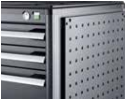
Version with perfo perforated panel