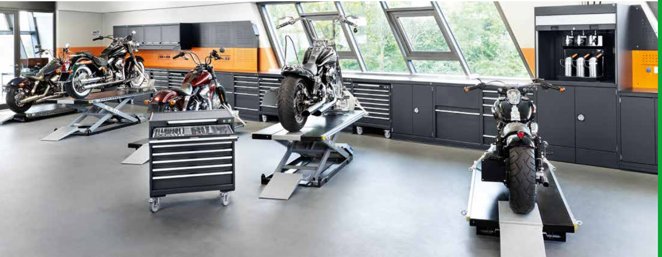
Harley Davidson Stuttgart Süd, Böblingen