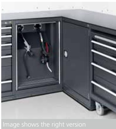
Image shows the right version