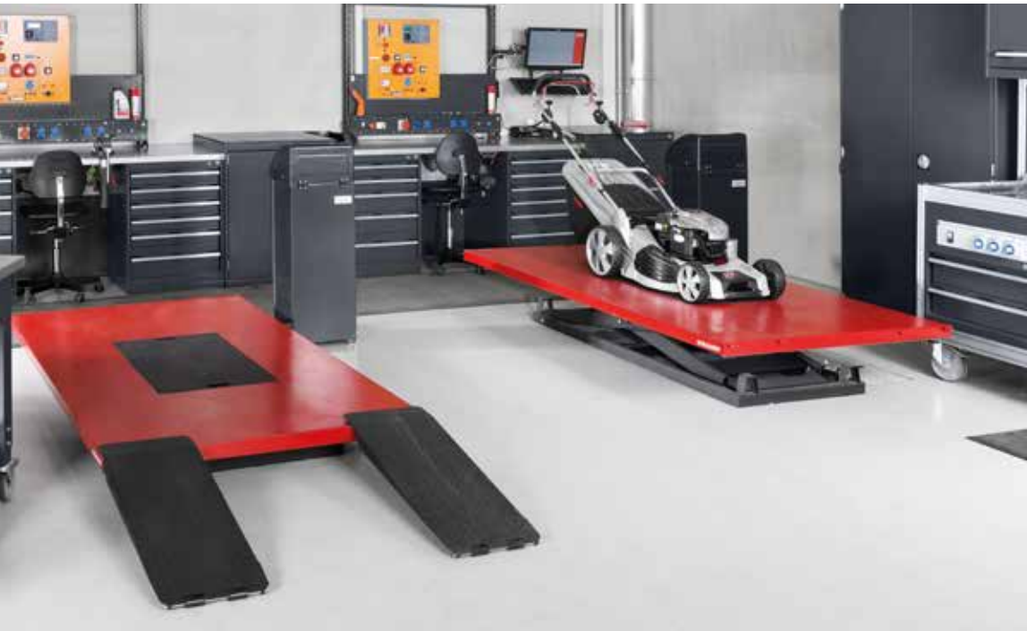
AL-KO KOBER AG, Kleinkötz