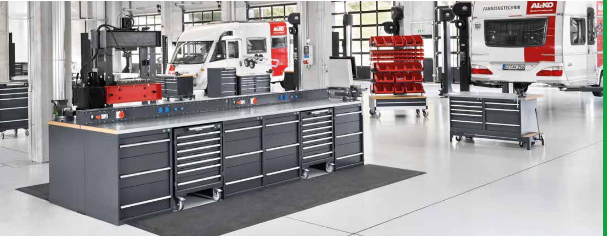
AL-KO KOBER AG, Kleinkötz