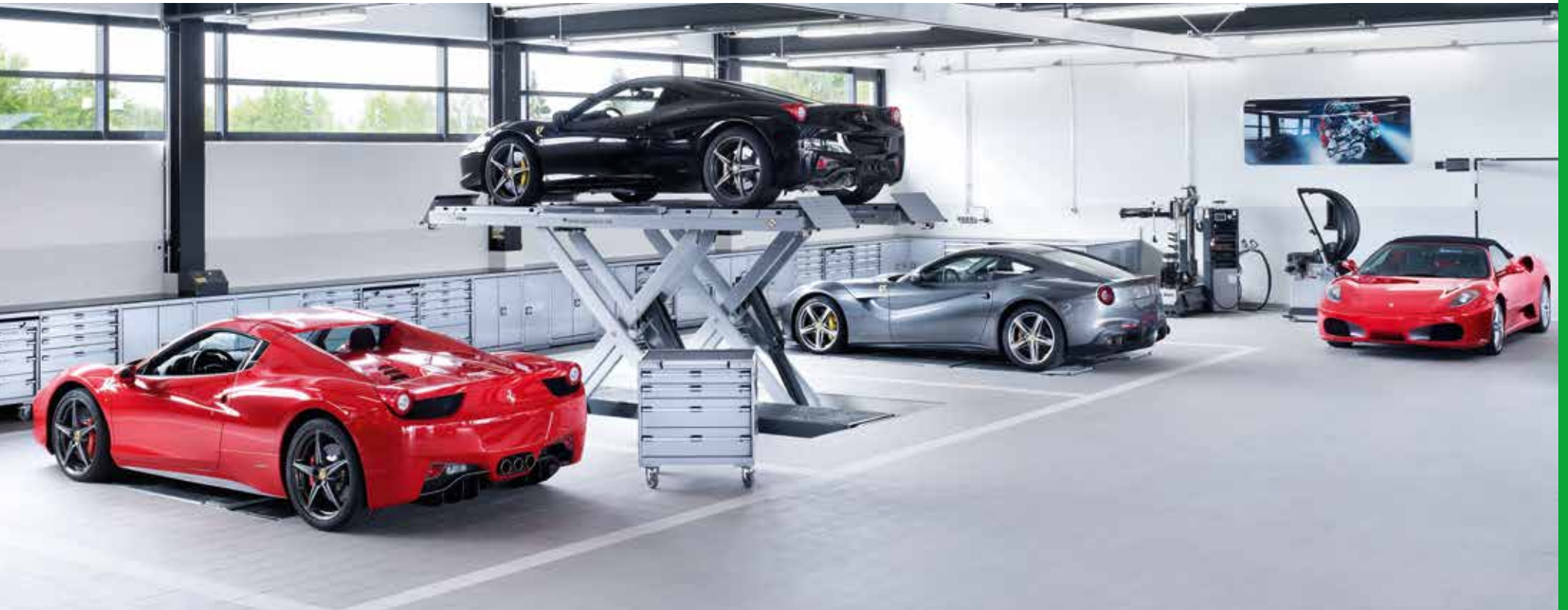
Autohaus A.Gohm GmbH, Böblingen