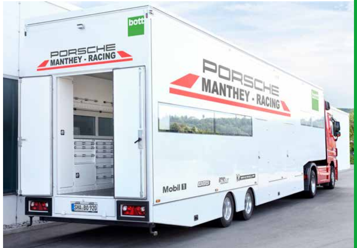
Porsche Team Manthey – the mobile workshop