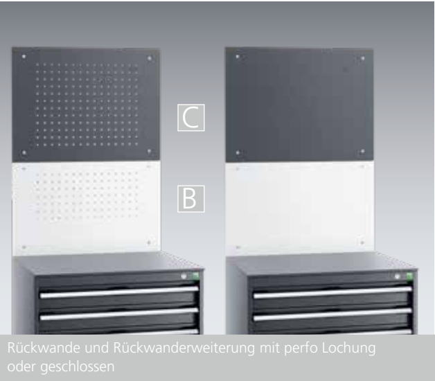
Rückwände und Rückwände mit perfo Lochung oder geschlossen