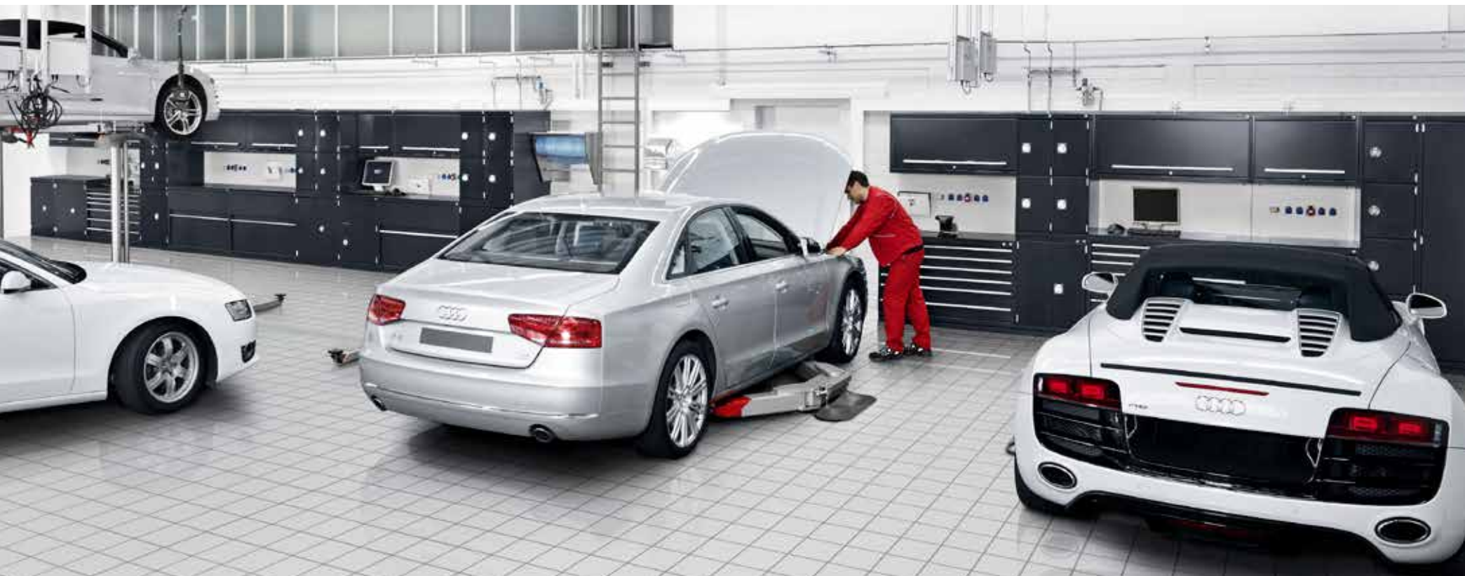
Audi Service Centre, Ingolstadt