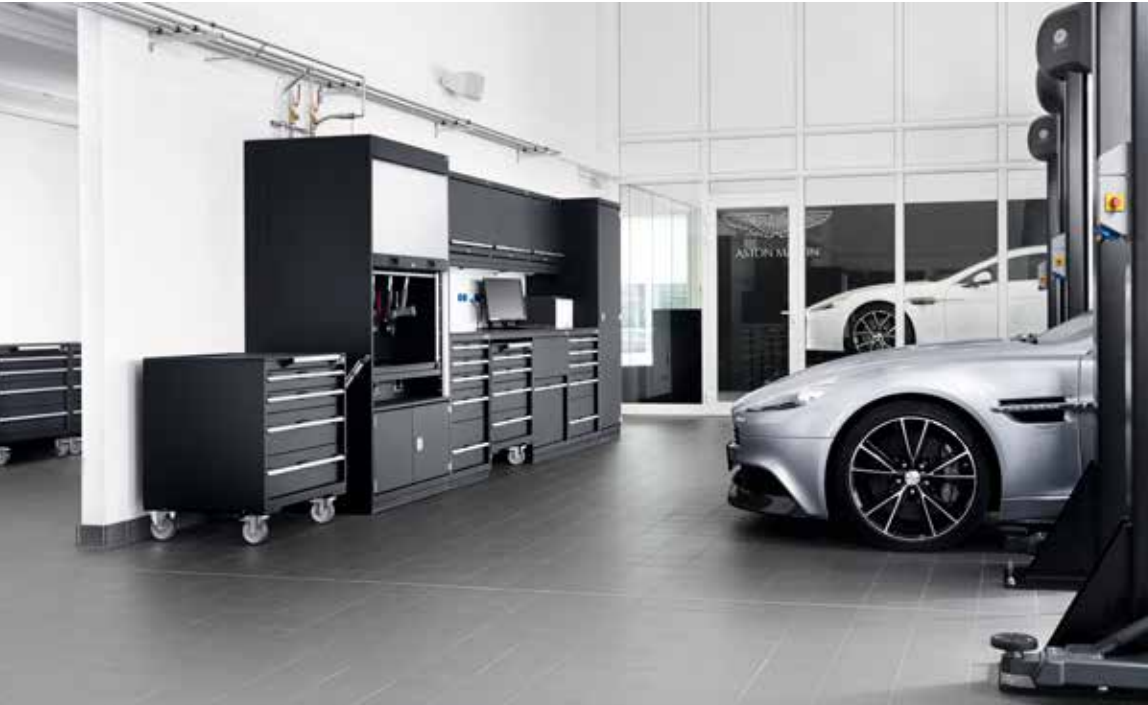
Aston Martin Stuttgart, AM Automobile GmbH

cubio Betriebseinrichtungen sind optimal auf die Tätigkeiten und Abläufe in Servicewerkstätten abgestimmt. Die übersichtliche Ordnung und ihre Funktionalitäten sorgen für effizientes Arbeiten. Alle Werkzeuge und Betriebsstoffe sind schnell zur Hand und haben ihren festen Aufbewahrungsort.