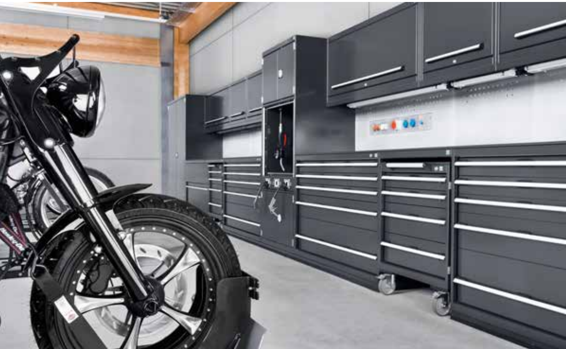
Harley Davidson, Bergstraße