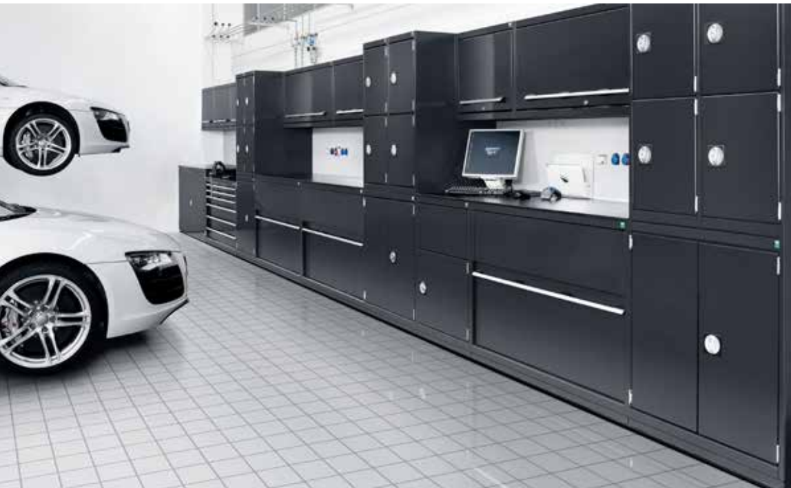
Audi Service Centre, Ingolstadt

Die Akquise von Kunden ist viel Arbeit. Sie langfristig von den eigenen Leistungen und Produkten zu überzeugen noch viel mehr. Der Servicebetrieb repräsentiert die Einstellung gegenüber der Arbeit und der Marke.