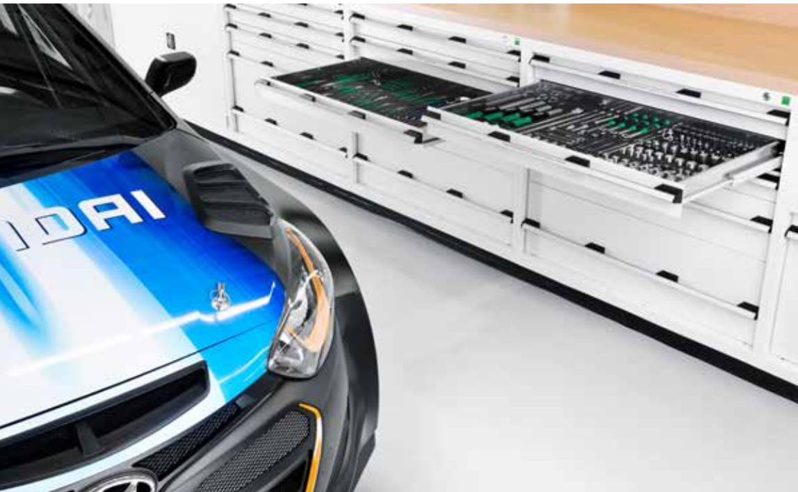
Hyundai Motorsport, Alzenau