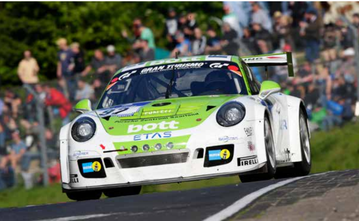
Porsche GT3 Cup 24h Race Nürburgring